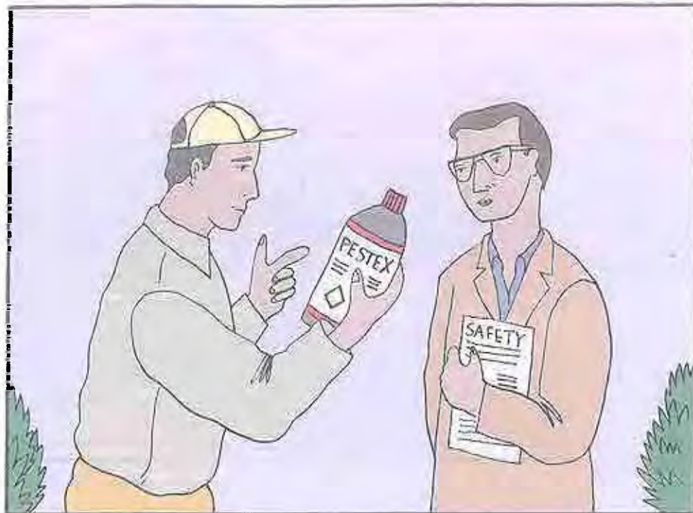
5. Lea las etiquetas y siga las instrucciones