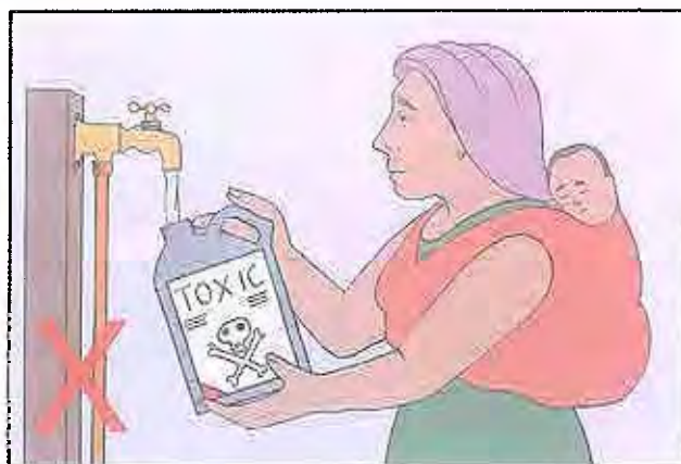
7a. No guarde agua en los envases vacíos