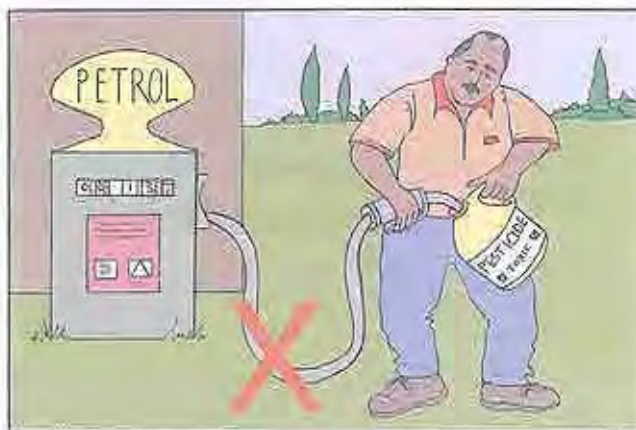
7b. No guarde combustibles en los envases vacíos