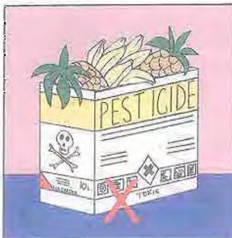
7c. No guarde alimentos en los envases vacíos