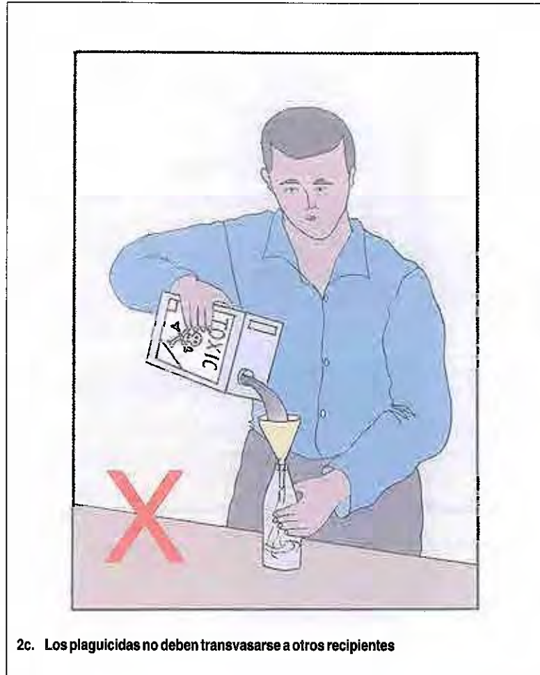
2c. Los plaguicidas no deben transvasarse a otros recipientes