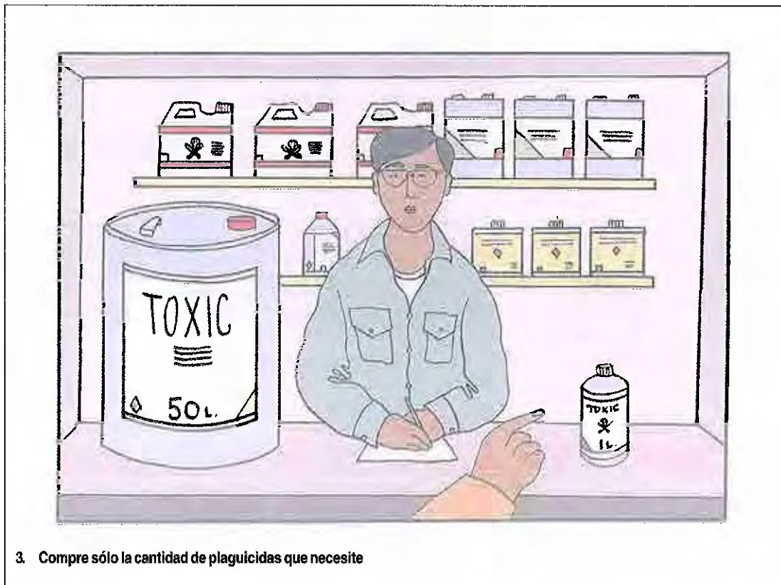
3. Compre sólo la cantidad de plaguicidas que necesite