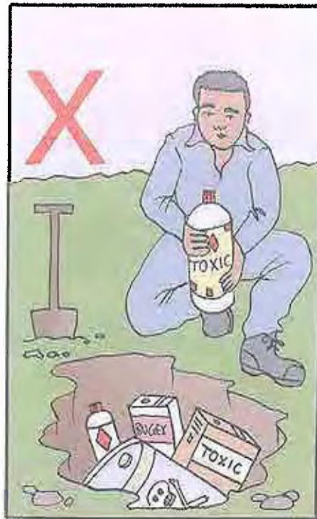
8a. No entierre los plaguicidas, los envases de plaguicidas, ni los desechos de plaguicidas