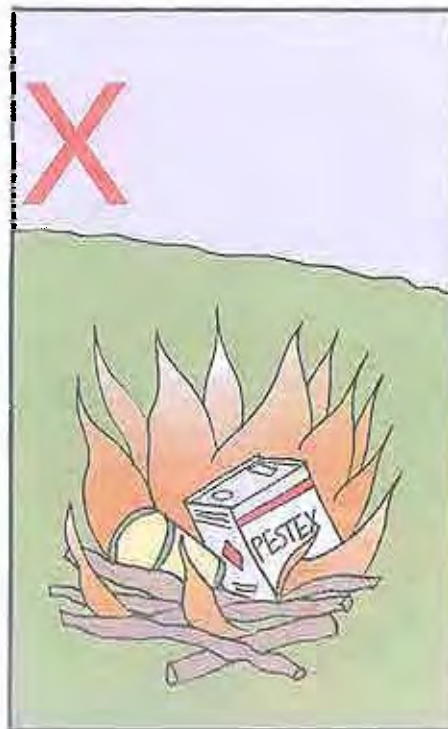
8b. No queme los plaguicidas, los envases de plaguicidas, ni los desechos de plaguicidas