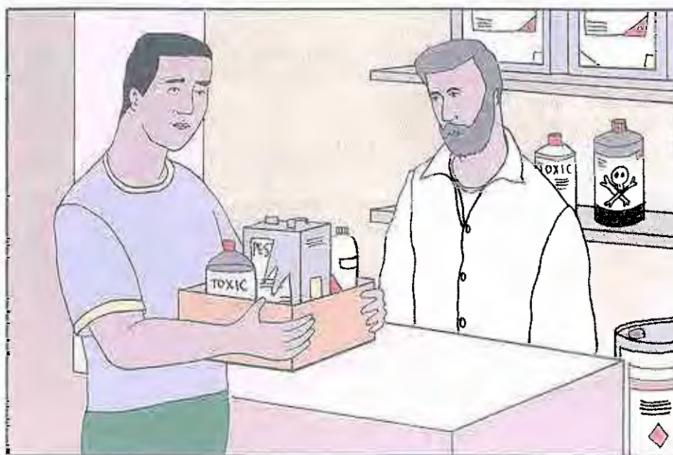
6. Devuelva a su proveedor los plaguicidas que no utilice o que no conozca